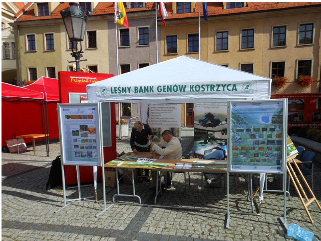
Fot. 1 Punkt informacyjny o projekcie.

W ramach wystawy przygotowano punkt informacyjny wraz ze stanowiskiem do edukacji o gatunkach zagrożonych i chronionych dla dzieci.