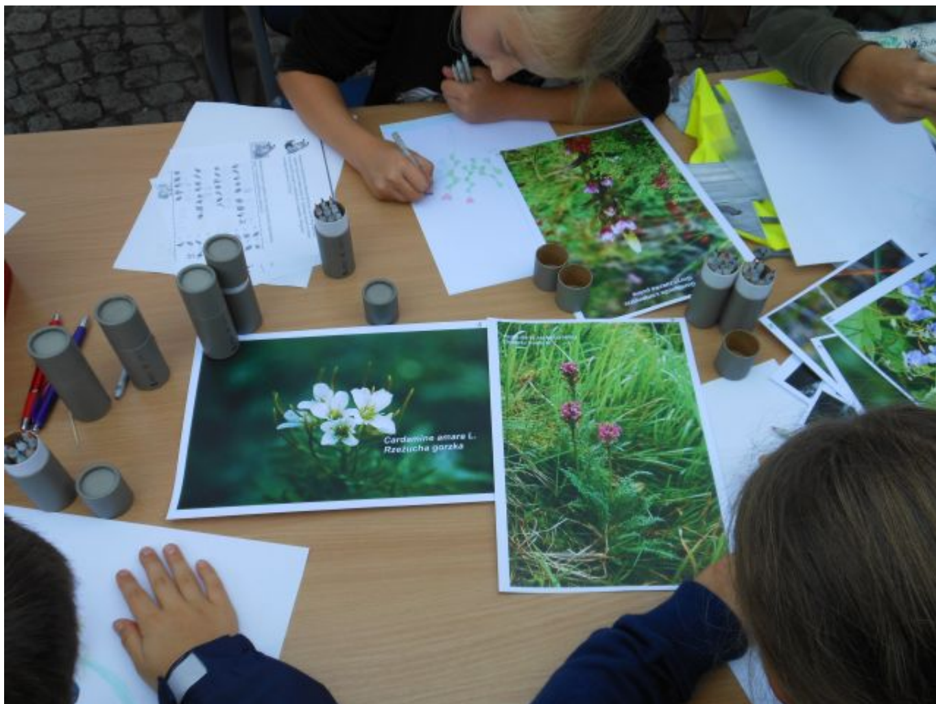
Fot. 3 Edukacja przez zabawę.

Dodatkowym aspektem utrwalającym działania informacyjne było stworzenie specjalnego stanowiska dla dzieci i młodzieży. Pracownik LBG Kostrzyca organizował konkursy oraz zabawy mające na celu poznanie gatunków zagrożonych i ginących, a także zadaniach na przyszłość w celu ochrony tych gatunków. Łącznie przez cały dzień na stanowisku zaangażowanych we wszelkiego rodzaju działania było ok. 100 dzieci i młodzieży. Nagrodzono ok. 80 osób, które otrzymały pamiątkowe zestawy upominków.