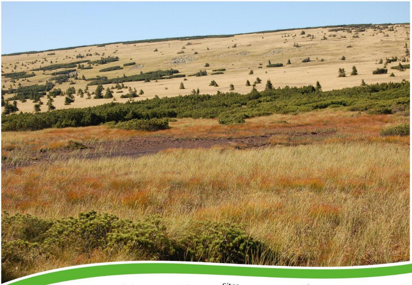
Carex magellanica Lam. - Fot. M. Malicki Karkonosze National Park