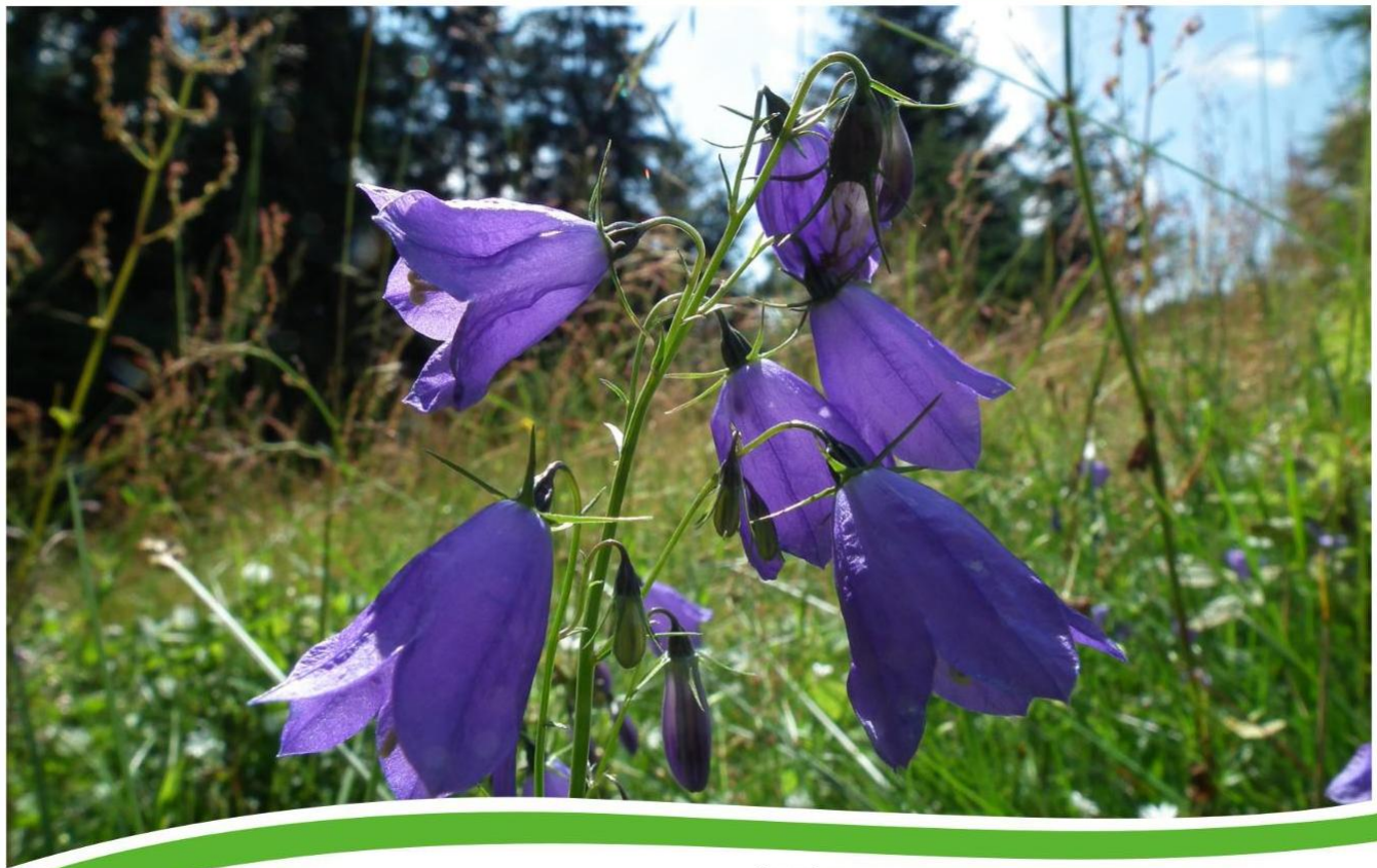
Campanula serrata (Kit.) Hendrych Beskid Żywiecki, Przełęcz Przegibek