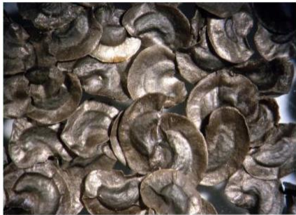
Euphrasia minima Jacq. ex DC.