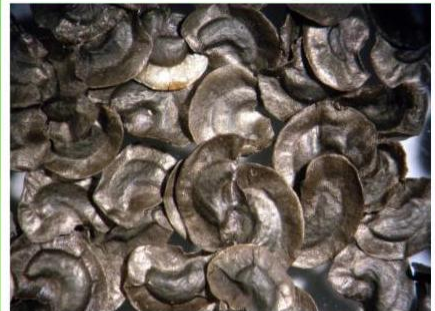
Linaria odora (M. Bleb) Fisch.