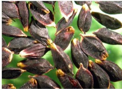
Carex parviflora L.