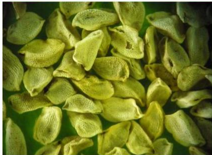
Pedicularis hacquetii