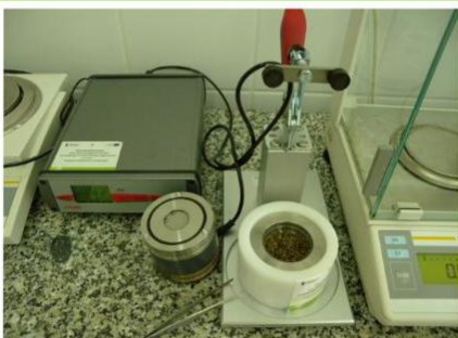
Determining humidity level with non-destructive method, fot. Dagmara Topola