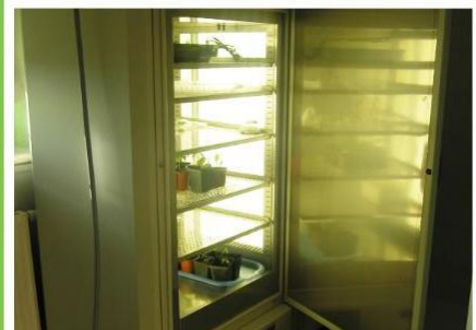
Climate chambers for breeding