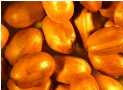
Scheuchzeria palustris L.