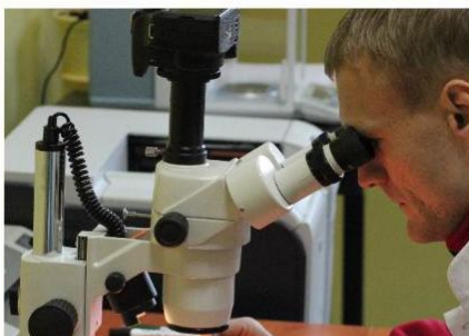
Seed cleaning