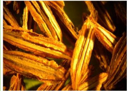
Laserpitium archangelica Wulfen