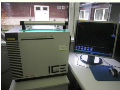
Preservation in cryogenic temperatures